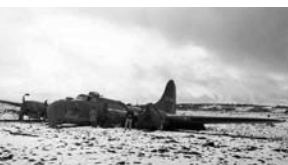
B-17 vélin á vettvangi