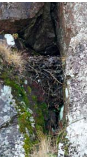
Laupur í Klifgjá

Miklar jarðskorpuhreyfingar hafa jafnan átt sér stað á skaganum. Þessar hreyfingar eiga sér enn stað og munu eiga sér stað í framtíðinni. Stöðug og hæg hreyfing í jarðskorpunni veldur spennu í bergi. Spennan getur orðið svo mikil að bergið þoli hana ekki lengur og berglögin bresti og þá verða jarðskjálftar. Sprungubarmarnir, sem koma fram við hreyfinguna kippast þá yfirleitt til í gagnstæðar áttir og standa mishátt. Sprungur sem myndast á þennan hátt nefnast misgengi. Á Klifgjá er ákjósanlegt skoðunarsvæði fyrir þá sem hafa áhuga á að skoða misgengi. Þegar fjær dregur eru misgengisþrep sem liggja hvert