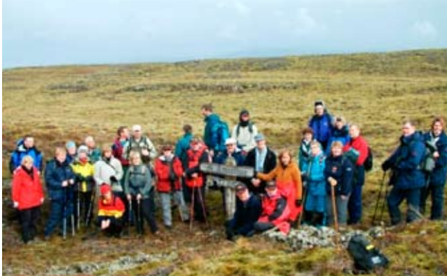
Gatnamótin – skilti