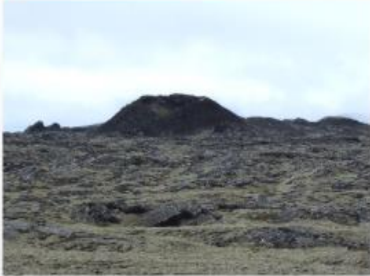
Rauðhóll sem Illahraun rann úr.

sjá djúpar holur, jarðföll. Frá Skst. 68 hefur vegurinn verið lagður að hluta fyrir vagna.