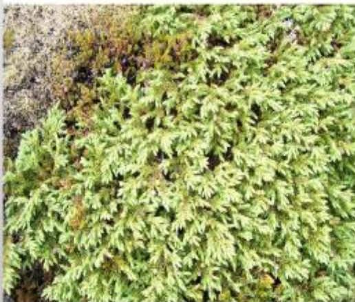
Einiberjalyng; lyngið var notað til skreytinga, sbr. jólavísuna „Göngum við í kringum einiberjarunn“.

Mosinn er aðalgróðurplanta Reykjaneskagans. Á Íslandi eru þekktar um 600 tegundir af mosum. Meginhluti íslenskra