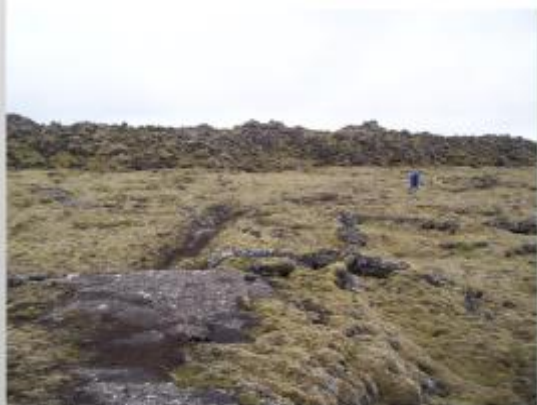
Helluhraun og apalhraun í Illahrauni.

Helluhraun eru slétt og greiðfær yfirferðar. Þegar þau storkna myndast fremur þunn og seig skán sem sígur áfram með rennsliinu á bráðnu undirlaginu. Við það gárast skánin