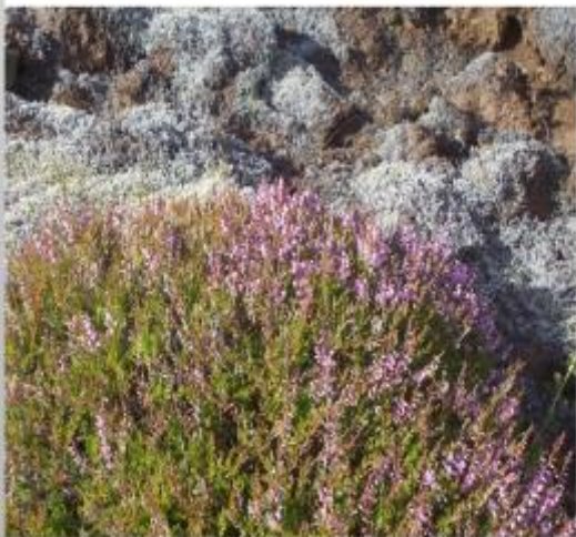
Beilyng; sú þjódtrú fylgir beilynginu að blómgist það mjög í toppinn verði vetur harður, en séu greinarendar blómlausir þarf ekki að kvíða vetri.

Á svæðinu má sjá ýmsar lyngtegundir: krækiberjalyng, bláberjalyng, beilyng, sortulyng, hrútaberjalyng og ýmsar grótegundir, s.s. skollafingur, skófir, kræðu og hreindýramosa. Einir er eina íslenska tegundin úr hópi barrviða. Blóðbergið með sínum fjólubláum blómum og ýmsar aðrar blómtegundir, gulmaðra, geldingahnappur, kornsúra, kattartunga, mæriustakkur, holurt og margar fleiri tegundir. Við Skipsstíg í Grindavíkurhlutanum er óvenju mikill lynggróður miðað við aðra staði á Reykjaneskaganum en þar kemur eflaust til að stigurinn liggur í lægð og skjóli fyrir vindum.