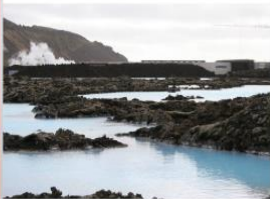
Kísilþörungur gefa vatninu bláleitt yfirbragð.

Allt þetta efni, sem kom upp við tilrauna-