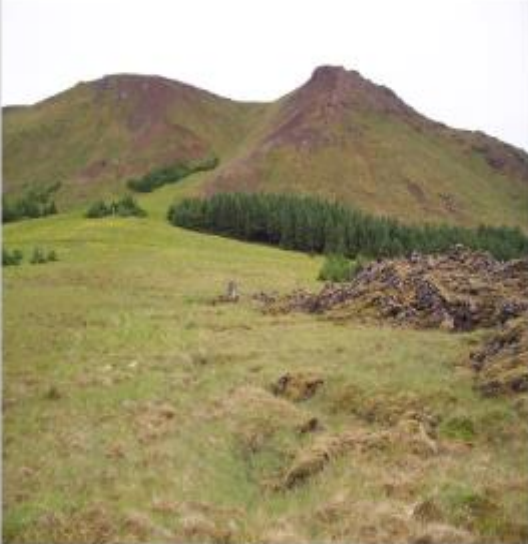
Minjar um sel sjást fremst á myndinni. Selskógur í Þorbirni.

Selskógur. Kvenfélag Grindavíkur hóf skógrækt í hliðum Þorbjarnar um 1950 og nefnist skógurinn Selskógur. Fyrir neðan hann, við jaðar hraunsins, má sjá minjar um sel þar sem Grindvíkingar höfðu fé sitt í seli og mjólkuðu ærnar í stekk. Annað sel er aðeins austar þar sem skógurinn er reyndar alveg ofan í selinu.