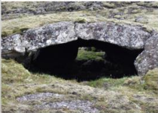
Litill hellir við Skípsstíg.

Sks. 66 Víða má sjá litla hella, skúta og gjár í úfnu hrauninu og í þeim stundum stóra, fallega burkna, tófugras. Þegar hraun renna yfir misfellur og fyrirstaða myndast reynir bráðin hraunkvikan að leita áframhaldandi leiða. Hún