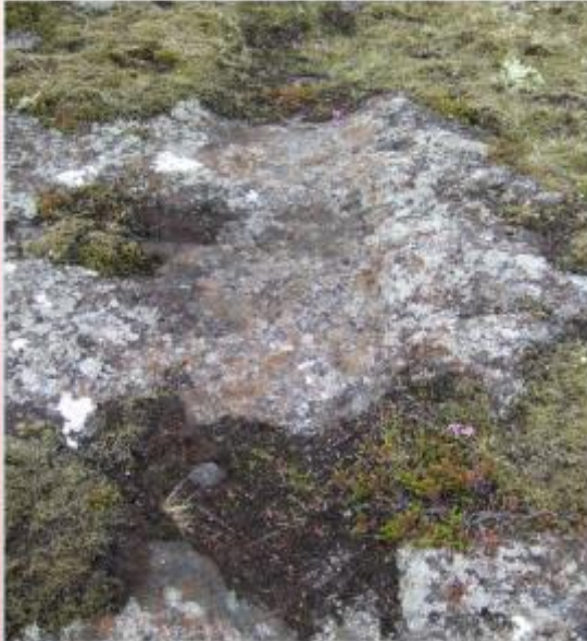
Vel mörkuð leið: Hófför og fótspor liðinna alda.

Skst. 85 Skipsstígur er forn þjóðleið milli Grindavíkur og Innri-Njarðvíkur. Stígurinn endurspeglar brú margbreytileikans, annars vegar vegagerð hinnar eðlislægu og skynsamlegu þarfar fortíðarinnar og hins vegar tilraun nútímans (eftir 1900) til að bregðast við breyttum þörfum samtímans, t.d. með tilkomu bílsins. Skipsstígur hefur því ekki einungis gildi sem fornleif (100 ára reglan) heldur og sem ápreifanlegur vottur þróunar í