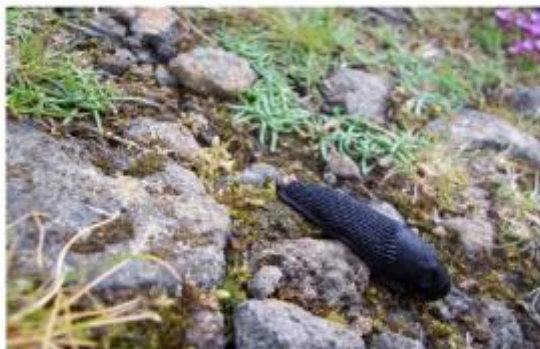
Svartsnigill; sú þjóðtrú fylgir að ef maður nái að snerta horn snigilsins þá sé hægt að óska sér.

Í fjallinu heldur fýllinn sig. Fýllinn getur orðið allt að 50 ára gamall. Munnmæli herma að kjötið af honum verði ekki seigt né heldur eldist í útliti þrátt fyrir háan aldur. Hrafn verpir í Þorbirni og þar má stundum sjá hrafnslaup (hreiður hrafnsins) í hæstu klettunum neðanverðum. Fleiri lífverur má sjá eins og svartsnigla sem eru óvenju stórir sniglar og